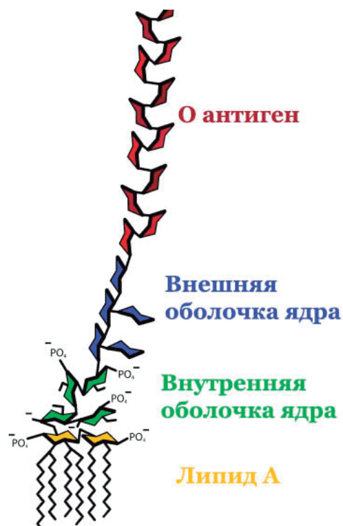
Рисунок 1. – Структура липополисахарида Figure 1. – Lipopolysaccharide structure

В структуре БЛПС имеется липид А, отвечающий за пирогенный эффект, а также полисахарид, включающий О-антиген, и центральный олигосахарид, или ядро (рис. 1) [2].