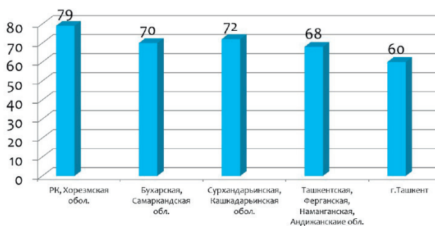
Рисунок 1. – Распространённость HP-инфекции по Узбекистану

По Узбекистану частота распространенности HP составляла в среднем более 80% в популяции (рис. 1). Это позволяет отнести Узбекистан к регионам с высокой степенью инфицированности HP. Также были выявлены 1367 идентичных генов с европейским штаммом HP26695 и 1162 гена, идентичных с генами африканского штамма J99. Эти гены составляют функциональное ядро генома HP. Выявлены два кластера генов – зоны пластичности, где доля штаммоспецифичных генов составляет 79% для зоны пластичности HP0423-HP0466 и 37% для зоны пластичности HP0982 – HP1028. Среди отдельных групп наиболее отличались штаммовой гетерогенностью гены, отвечающие за метаболизм ДНК и белки клеточной оболочки. Изучено географическое распределение генотипов HP, где во всех регионах преобладает CagA положительный вариант (рис. 2). VacAs1m1 чаще встречался в Хорезмском регионе и Каракалпакстане, VacAs1m2 в Намангане и Ташкенте, в Хорезме