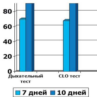
Рисунок 4. – Эрадикация HP инфекции по результатам дыхательного теста и CLO теста

ной схемы лечения в разных регионах мира уже составляет от 60 до 78%, но не удовлетворяет требованиям современной гастроэнтерологии, где нижний порог эффективности эрадикации составляет не менее 80%. Проведенные в нашем регионе исследования показали, что эффективность стандартной, «тройной» 7-дневной эрадикационной терапии составила по показателям прямого уреазного теста 64%, дыхательного теста – 65%, что мы склонны рассматривать как неудовлетворительные результаты (рис. 4).